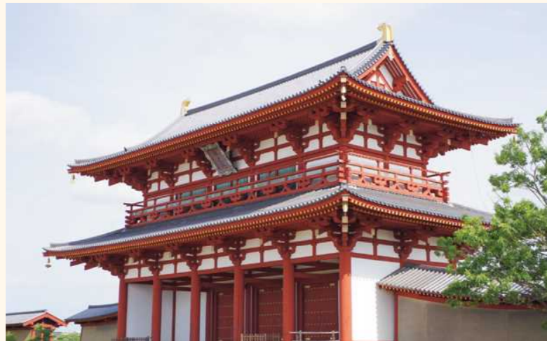
■平城宮跡朱雀門(化粧材、野物材、建具材)