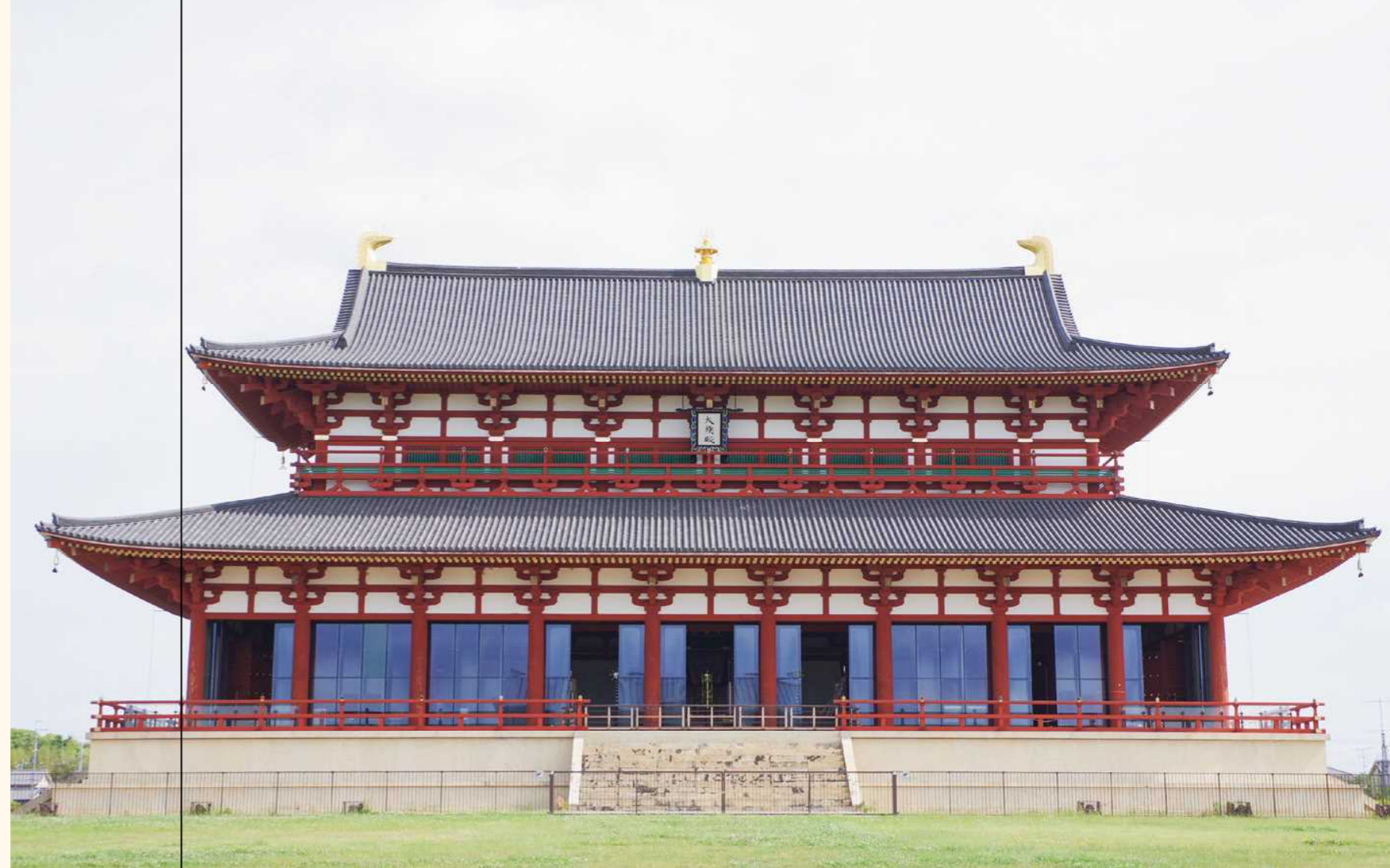
■平城宮跡第一次大極殿正殿(化粧材、野物材、建具材)