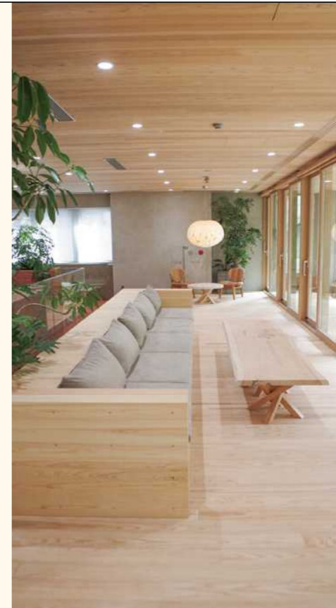
■オフィスビルバルコニー