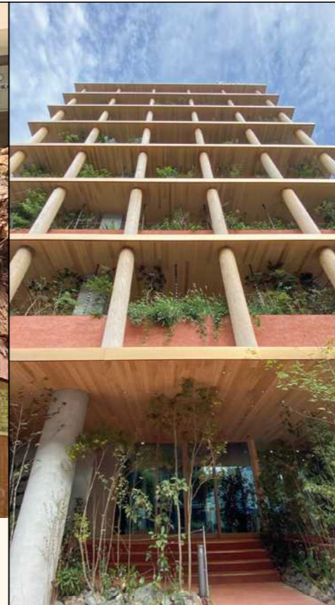
■オフィスビルファサード