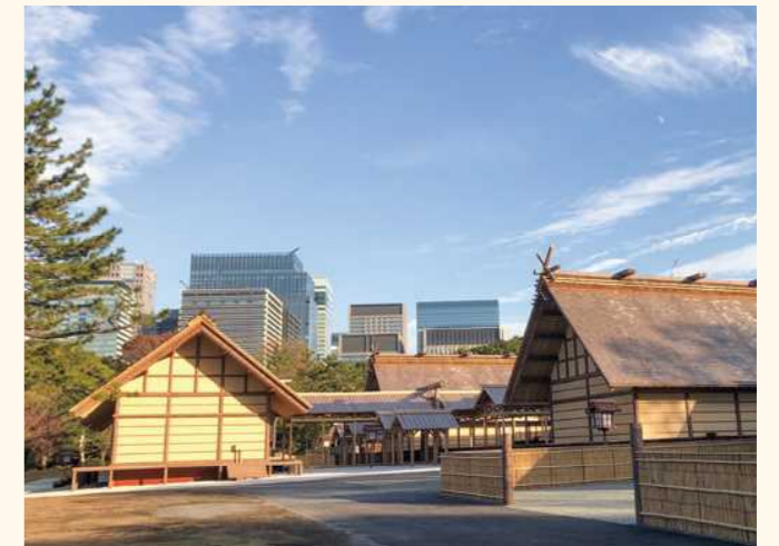
■大嘗宮(化粧材、野物材、建具材)

日本で最も古い植林の歴史をもつ、吉野地方。密植多間伐(みっしょくたかんばつ)という独特な手法により節が少なく、本末同大(ほんまつどうだい)・均一な年輪幅といった特徴をもった美しく強い製品を生み出すことができます。 吉野銘木製造販売株式会社の強みは、社有林を持ち、吉野の山の麓に事業所があることで、林家とのコミュニケーションがスムーズに取れ、いち早く良材や入手困難な材を確保することができます。また、乾燥方法も高温から低温、自然乾燥まで指定して頂くことができ、効率のよい商品づくりができることです。吉野材に限らず、情報を共有してきた、良材の扱いを得意とする製材会社とのネットワークを構築しており、全国的にも集荷の難しい材料の調達も、この体制により供給することも可能。また、建設業許可、設計事務所登録も行っており、少人数スタッフでの木工事にも対応できます。