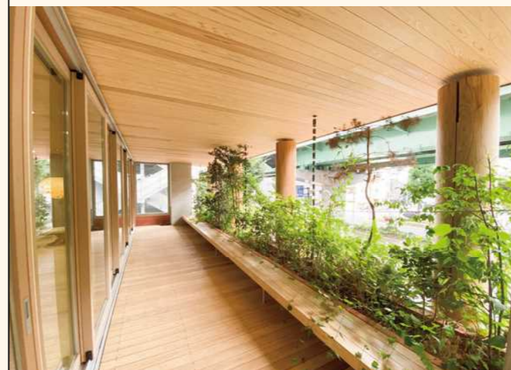
■オフィスビル内装

吉野松・杉を中心に新建材との比較を体感して頂けるショールームがあり、工場・製材の見学を併せて見学することで、木材について深く知ることができます。内外装に使用する無垢材は、木が持つ本来の耐久性や強度、体に良い成分が無くならないように、できるだけ高温乾燥を避け、中温乾燥、低温乾燥と自然乾燥を併用した乾燥方法で丁寧にじっくり乾燥させた乾燥材を使用します。また、JAS、森林認証材、合法木材等、各種認証材も取り扱い可能です。